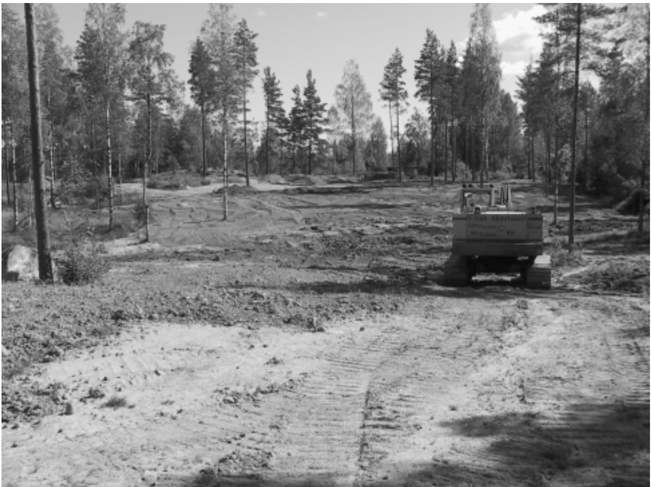
Bild från banprojekter