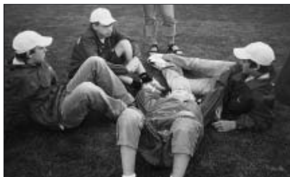
Invigningen blev ganska lång, tyckte killarna från Karlskoga...