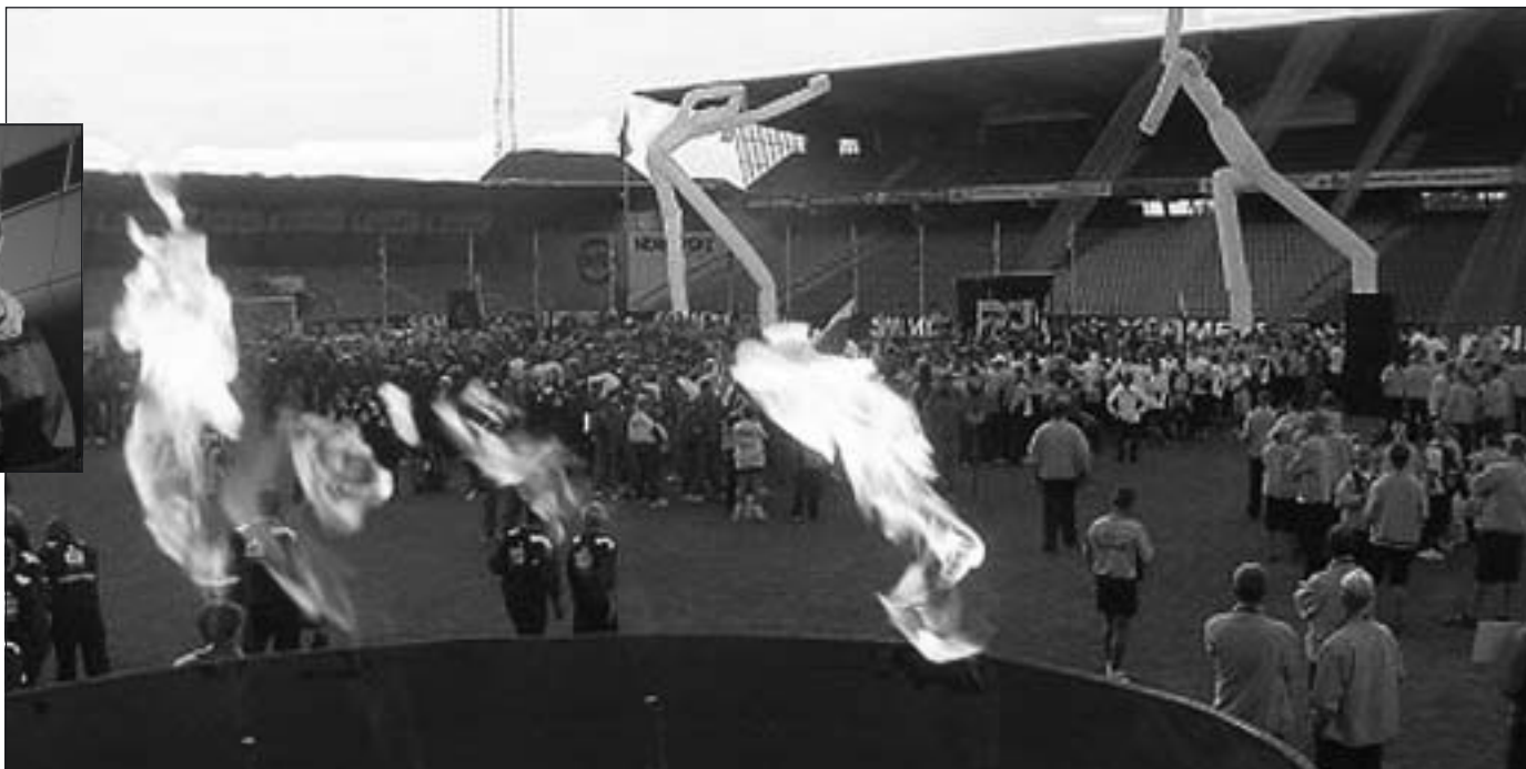
Invigningen av UL2003 var av olympiskt mått. Givetvis tändes en eld som brann under hela veckan.